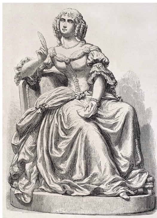
Madame de Sévigné, épistolière et écrivaine du XVII e siècle qui employait l'accord selon le sens.

Ainsi, Vaugelas admet lui-même la bizarrerie de cette réforme ! Rien d'étonnant que ces nouvelles règles grammaticales n'aient pas été adoptées instantanément, et aient mis du temps à s'imposer. 3